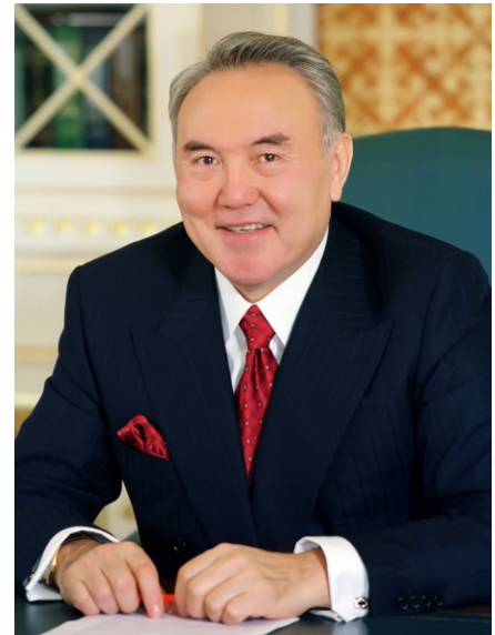
Нұрсұлтан Назарбаев Қазақстан Республикасының Президенті 2014 жылғы 2 қыркүйек

«Бүгінде құқықтық салада сыбайлас жемқорлыққа қарсы тиімді күреске бағытталған бірқатар реформалар жүргізілді. Бірақ олар жеткіліксіз. ... Қазақстан Республикасының 2025 жылға дейінгі сыбайлас жемқорлыққа қарсы стратегиясын қабылдау қажет. Мемлекет қызмет өкілеттігін жеке мақсаттарға пайдалану тиімсіз әрі мүмкін емес болатындай жағдайлар жасауы керек. Ол үшін осы жұмыстағы әлемдік озық тәжірибелерден үйренген жөн.»