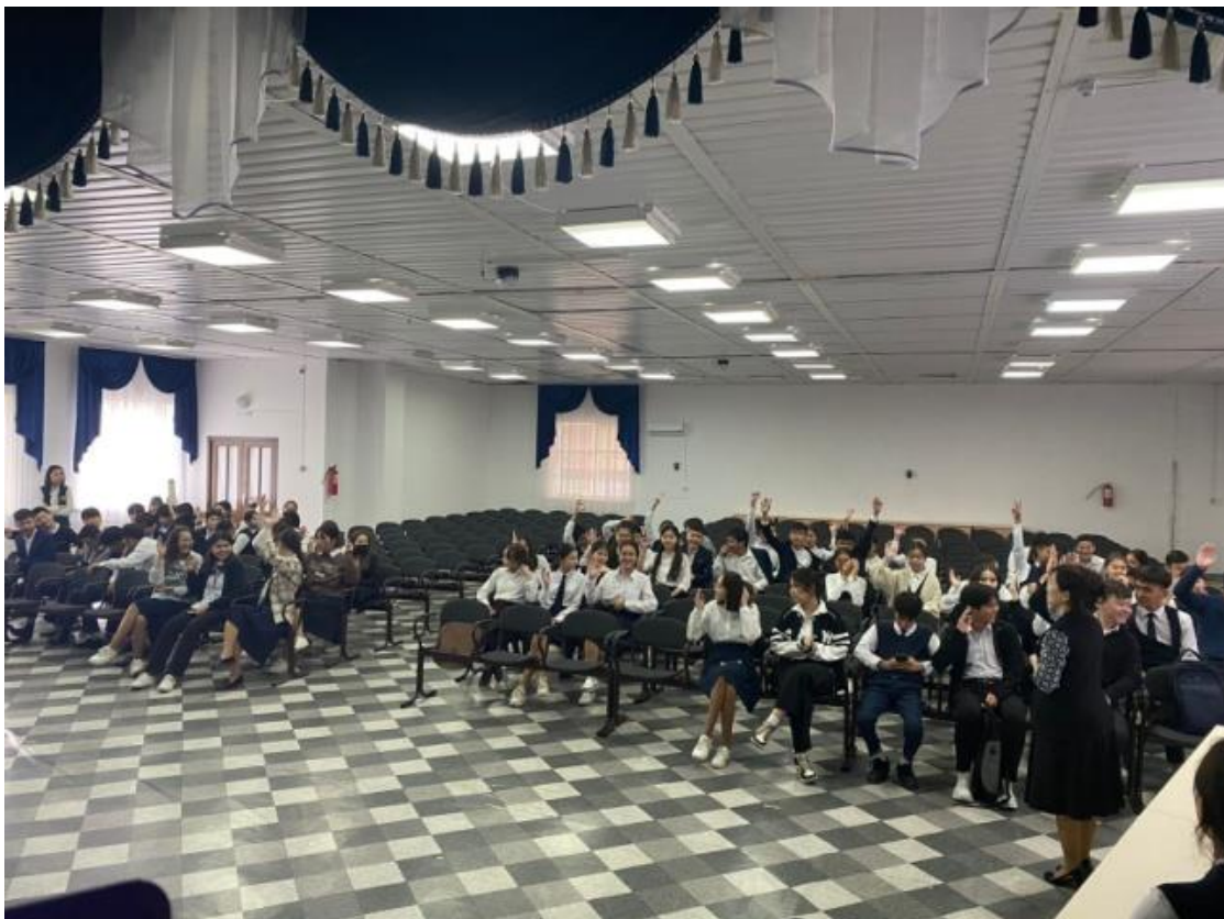
Орындаған: Бакбергенова Г.Т.