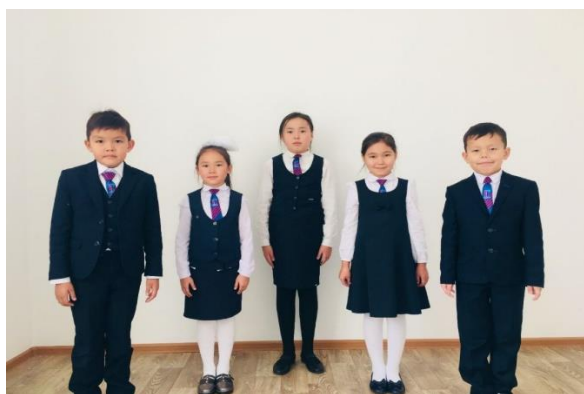
1-4 кластар үшін

13. Мектеп формасына түрлі діни конфессияларға қатысты киім элементтерін қосуға болмайды.