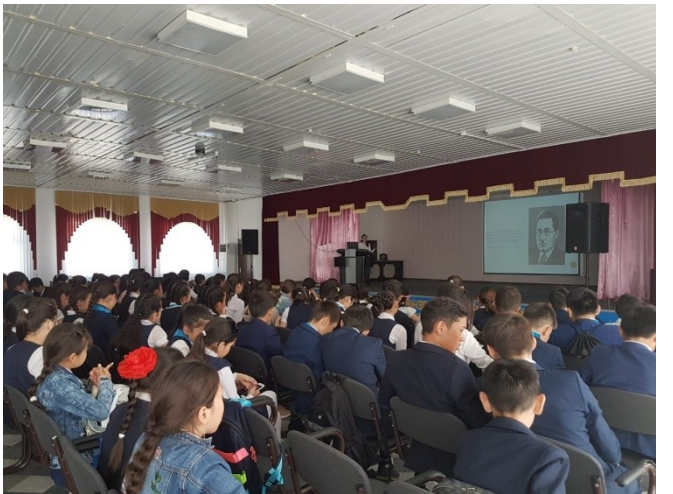
Орындаған: Жасаганбергенова Б.И